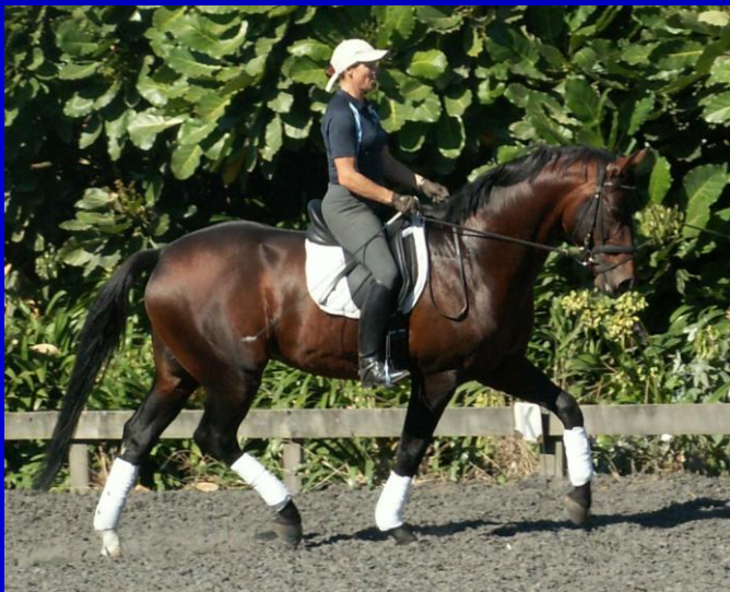
Vanessa Way NZ, junger Hengst

Wichtige Merkmale eines funktionierenden Reitsitzes: